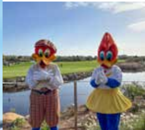
Torneo de golf solidario