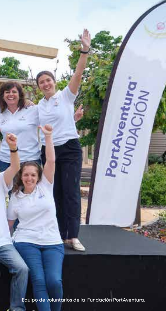
Equipo de voluntarios de la Fundación PortAventura.