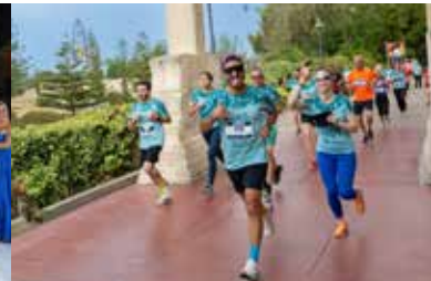
Fun Run, carrera solidaria